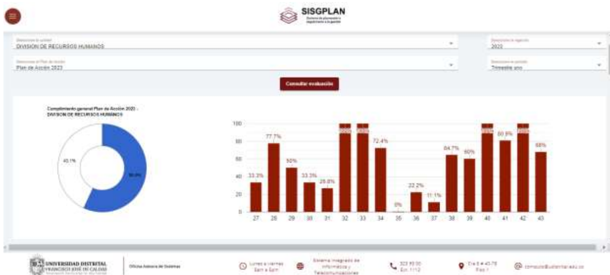
Ilustración 3. Evaluación del Plan de Acción en SISGPLAN: Cumplimiento general del Plan