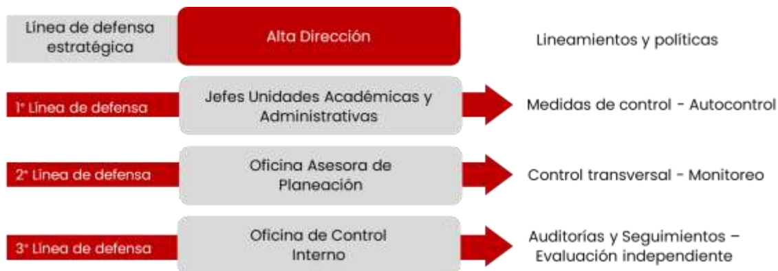
Ilustración 4. Esquema de responsabilidad

Control Interno, en su rol de auditoría y seguimiento independiente. El siguiente esquema ilustra dicho despliegue: