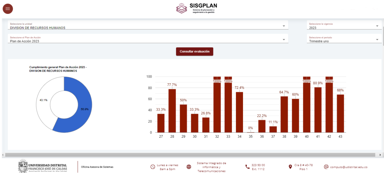
Ilustración 3. Evaluación del Plan de Acción en SISGPLAN: Cumplimiento general del Plan