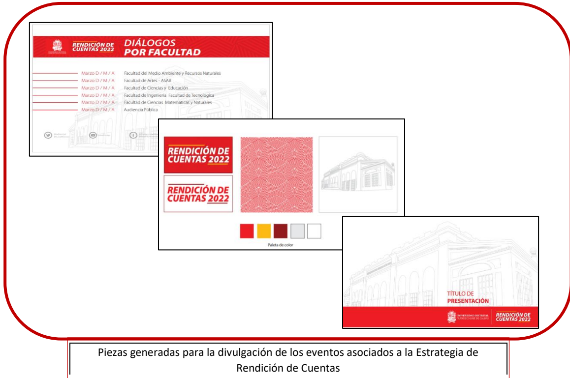
Piezas generadas para la divulgación de los eventos asociados a la Estrategia de Rendición de Cuentas

La Oficina de Quejas, Reclamos y Atención al Ciudadano, en conjunto con la Sección de Publicaciones, presentó las siguientes piezas gráficas que se utilizaron en la divulgación y presentación de los eventos asociados a la Estrategia de Rendición de Cuentas.